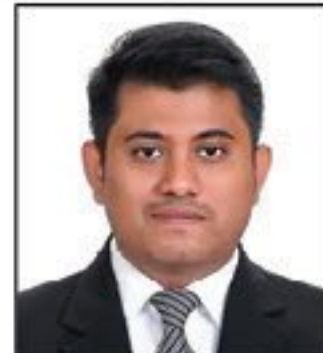
মাহির ট্রাভেল কনসালটেন্ট ৮ বছরের অভিজ্ঞ