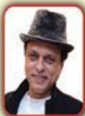
Badshah Bulbul Cultural Secretary