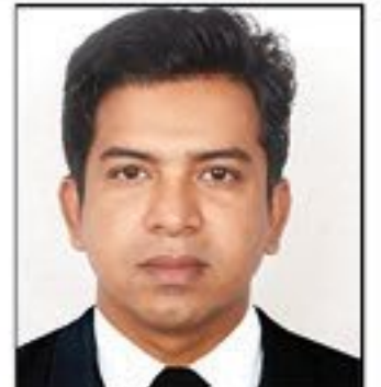
জাহাঙ্গীর ট্রাভেল কনসালটেন্ট ১০ বছরের অভিজ্ঞ

7305 37th Road, Jackson Heights, NY 11372 (কাবাব কিং এর পার্শ্ব, ডাইভারসিটি প্লাজায়)