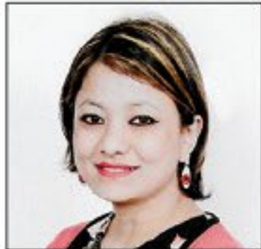
কাখুন ট্রাভেল কনসালটেন্ট ১২ বছরের অভিজ্ঞ