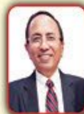
Sheikh Illas Executive Member