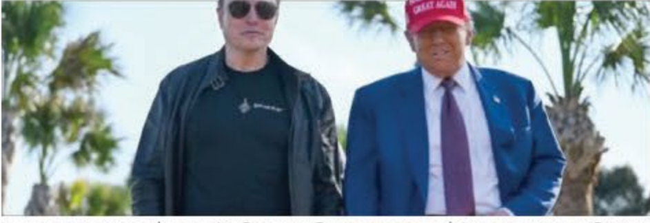
ইলন মাস্কের মহাকাশ সংস্থা স্পেস এক্সের ট্রেনিং সেন্টারের বোকা ডিকা লঞ্চপ্যাড থেকে রকেট উৎক্ষেপণ করা হয়। এর নিয়ন্ত্রণ কক্ষ থেকে পর্যবেক্ষণ করেছেন ডোনাল্ড ট্রাম্প। এ সময় নবনির্বাচিত প্রেসিডেন্টের সঙ্গেই ছিলেন ইলন মাস্ক।